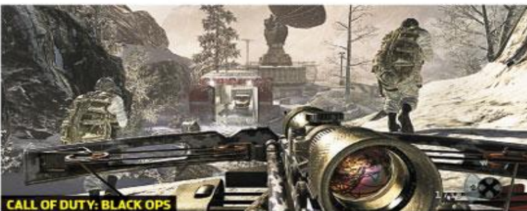
CALL OF DUTY: BLACK OPS