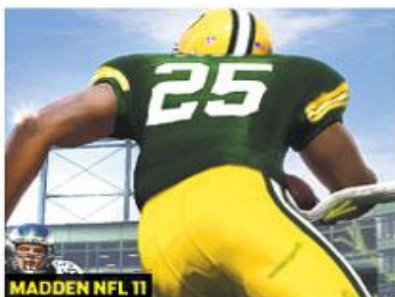
MADDEN NFL 11

33 laparoscopic surgeons who had played videogames for at least three hours a week made 37% fewer errors on advanced surgical skills than those who did not, a study showed.