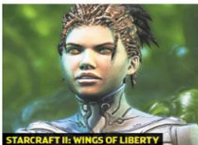
STARCRRAFT II: WINGS OF LIBERTY