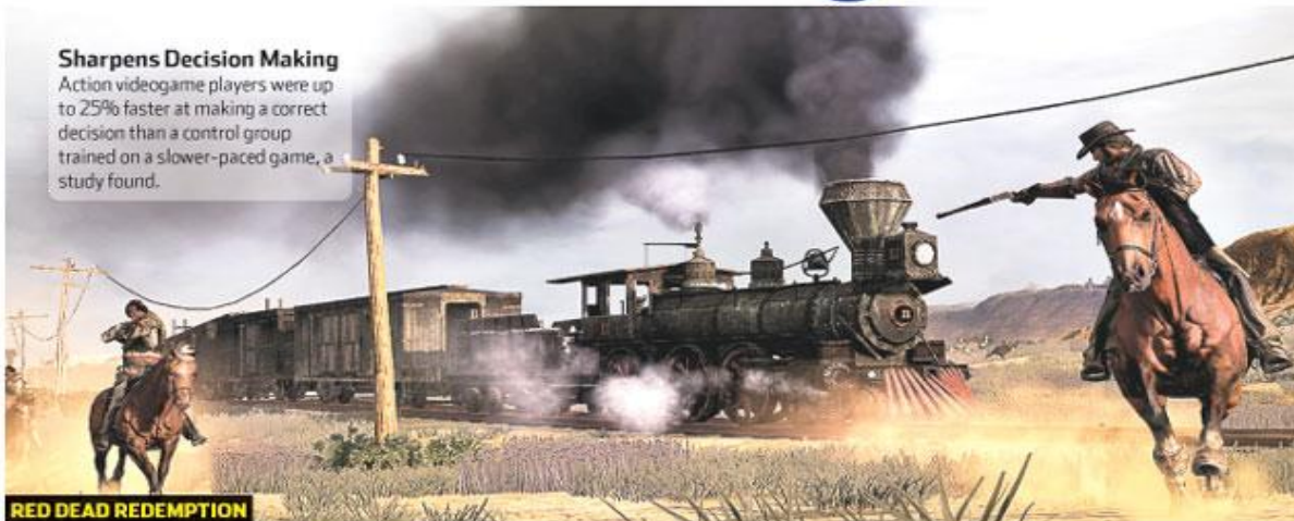
RED DEAD REDEMPTION

Action videogame players were up to 25% faster at making a correct decision than a control group trained on a slower-paced game, a study found.